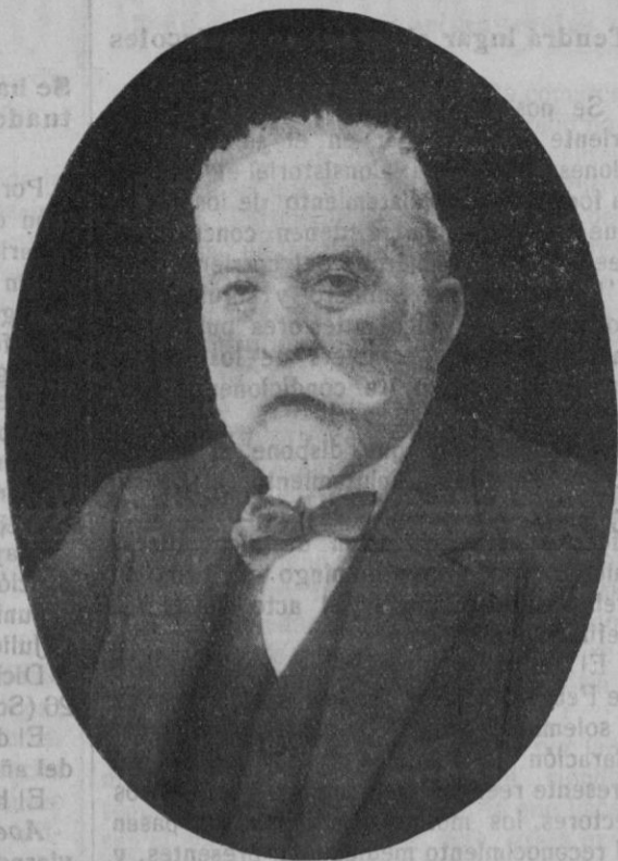
MIGUEL MARQUÉS COLL.

Demà farà un any que emprengué viatge cap a l'Eternitat l'enyorat Metge Mayol. Cap figura més representativa que la seva per inaugurar aquesta secció biogràfica que volem convertir en galeria d'honor de tots aquells qui sobresortin en una o altra activitat o ocupin un lloc preferent en l'atenció pública del nostre poble durant el breu interregne de la setmana. Al Metge Mayol li cap ben bé aquesta modesta distinció, per quant a la seva bonhomia patriarcal i als seus mereixements professionals s'hi ajuntava el valor simbòlic de la seva obra obscura i intensa de cada dia, que quedarà com un model a imitar per les joves generacions qui es succeeixen.