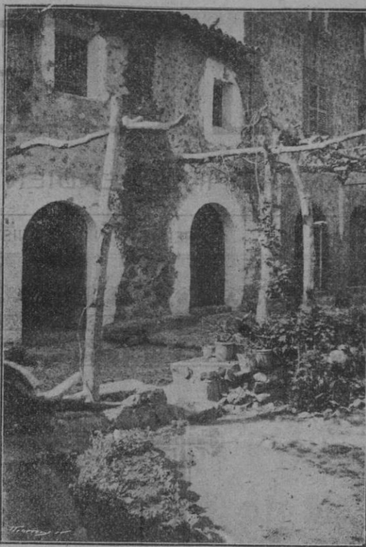
Vetusta casa de Ca'n Tamany, hogar de «Les Valentes Dones.»