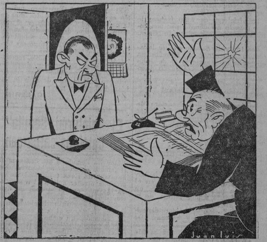
EL NUEVO CONTABLE

—¿No sabe sentar una partida y dice que estaba en un Banco?... —Sí, señor. En un banco de la Plaza Nueva.