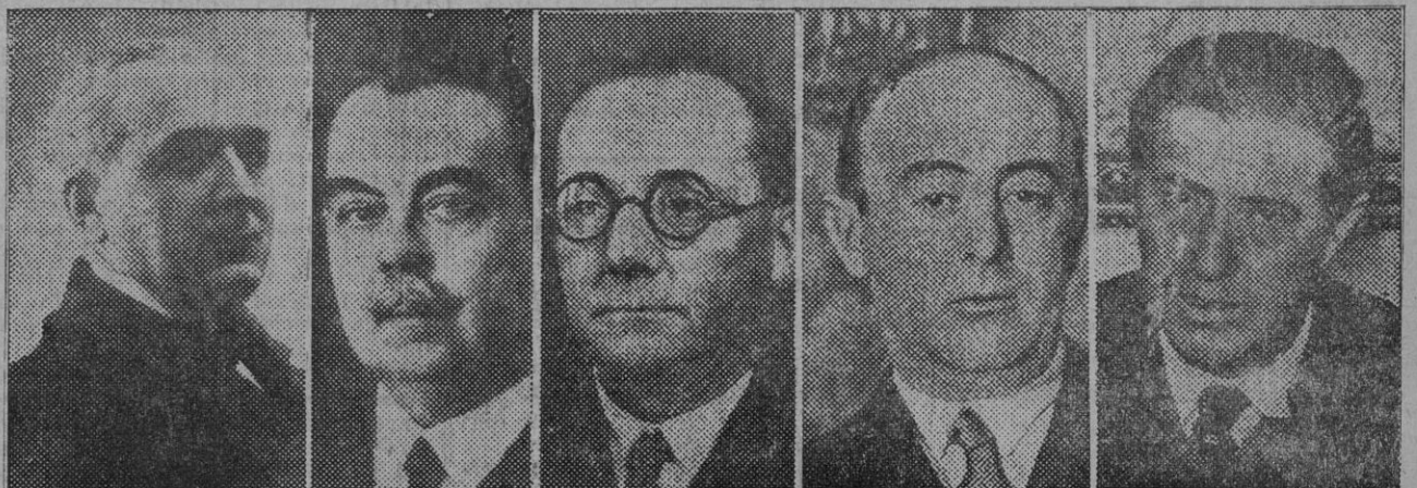
Los nuevos ministros: De Estado, don Augusto Barcia; de Justicia, don Manuel Blasco Garzón; de Marina, don José Giral; de Hacienda, don Enrique Ramos; de Industria y Comercio, don Plácido Alvarez Buyla.

Se habla incluso de nuevas posibilidades que es prematuro recoger porque aún no son más que comentarios y vaticinios.