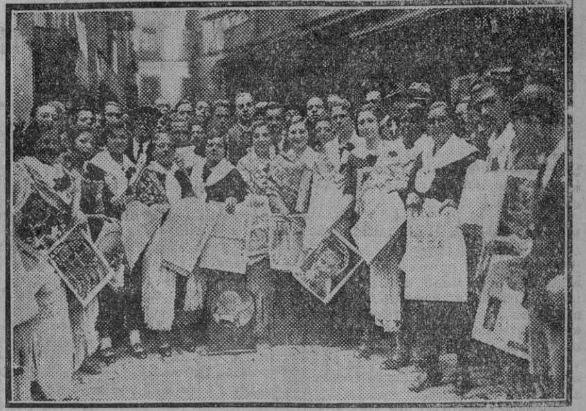
Los vendedores de periódicos han celebrado su día en Madrid. Nota destacada de la fiesta ha sido la cooperación de las vendedoras que, ataviadas al modo típico madrileño, hicieron su venta en la vía pública.