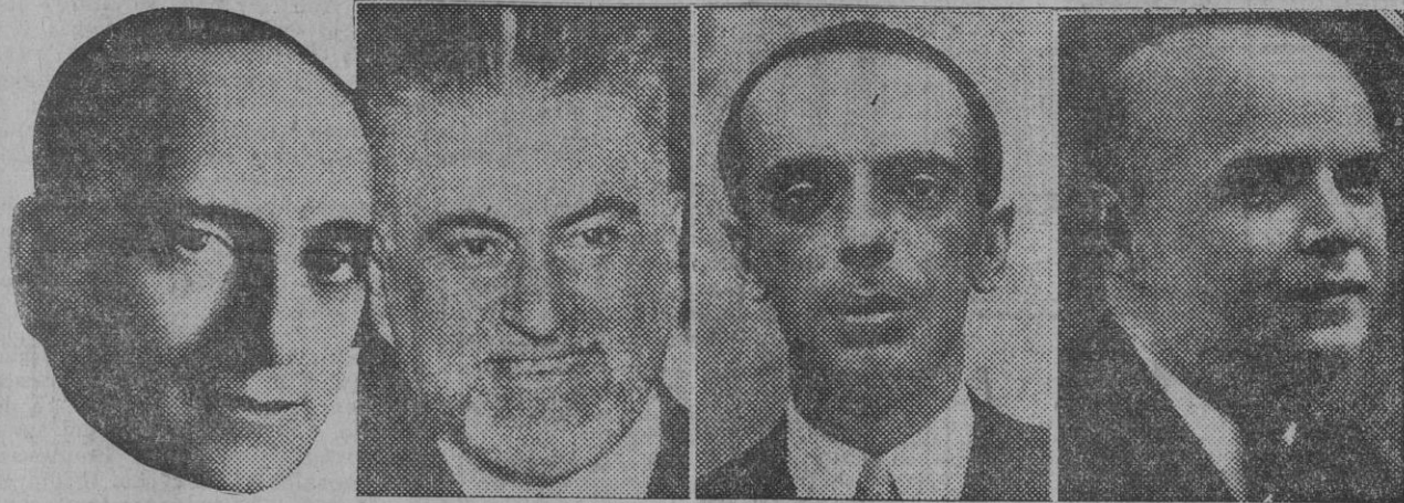
El jefe del Gobierno, señor José María Quiroga, y los ministros, el de Instrucción, don Francisco Barnes; el de Trabajo y Sanidad, don Juan Lluhi y Vallesca, y el de Agricultura, don Mariano Ruiz Funes.

El nuevo Gobierno debe ser una suma de voluntades en acción para servir los anhelos constructivos del país que confía en que la hora actual sea la de las realidades prácticas