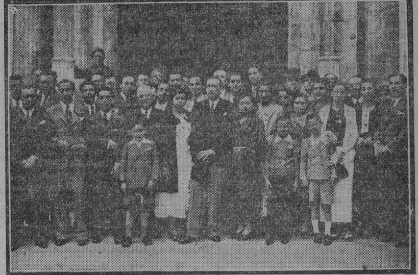
En la mañana del domingo los socios de la Tertulia del Arenal, en cumplimiento de los fines culturales de dicha entidad, hicieron una detenida visita al Alcázar.