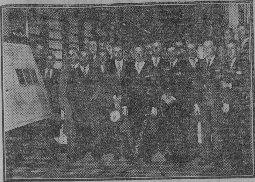
Oficiales y guardias marinas de la fragata «Presidente Sarmiento», que, de paso en Sevilla, para asistir á la toma de posesión del nuevo Presidente de la República, visitaron el Archivo de Indias, donde está obtenida la foto.