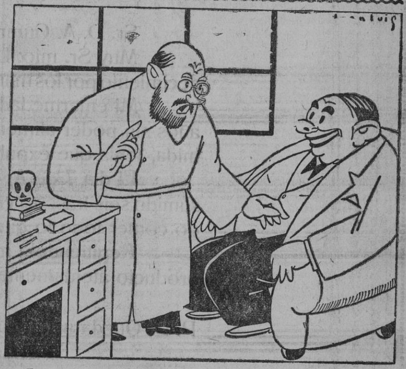
—¡Tenga usted presente que todo esto es tejido adiposo! —¡No me fastidie, doctor! ¡Lo he comprado como inglés auténtico!