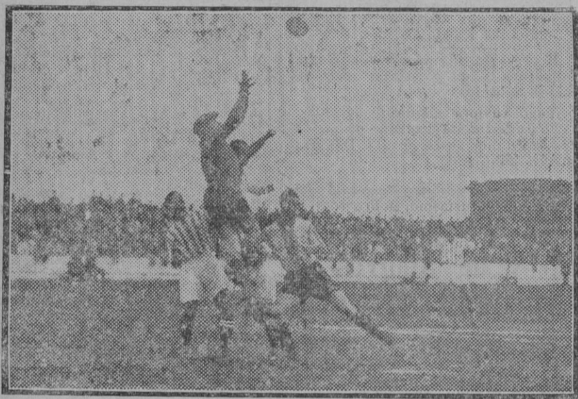
DEL PARTIDO BETIS-ESPAÑOL.—Urquiaga despeja por alto.

La culpabilidad del deleznable guarismo :