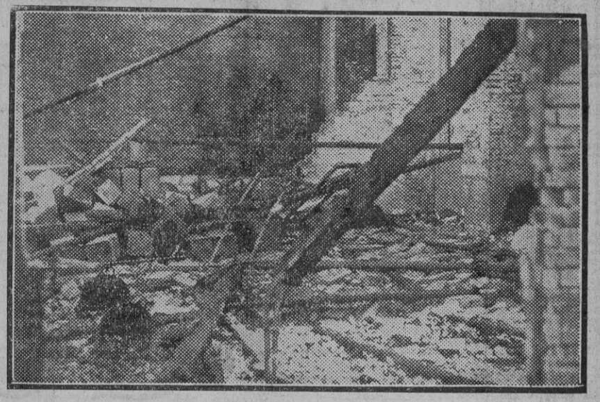
Estado en que quedó una de las nave de la destilería.