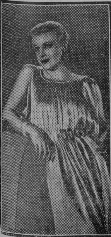
Ginger Rogers, juvenil estrella del cine americano.

de los Quintero, «Flor de la vida», que obtuvo un lisonjero éxito. —Gran parte de nuestra información telefónica la ocupaban noticias sobre el fallecimiento del polígrafo aragonés Joaquín Costa. El señor Canalejas daba cuenta del acuerdo de abrir una suscripción para erigirle un mausoleo. —Los dependientes de ultramarinos se habían dirigido a los Poderes públicos en solicitud de que ya que no se les concediese el cierre a las ocho como a los establecimientos de tejidos, se les permitiese descansar un día a la semana.