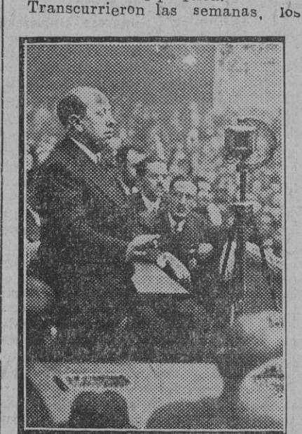
El jefe nacional de la C. E. D. A. en un momento de su discurso

Aquel ministro de Obras Públicas, que no pertenecía á nuestro parti-