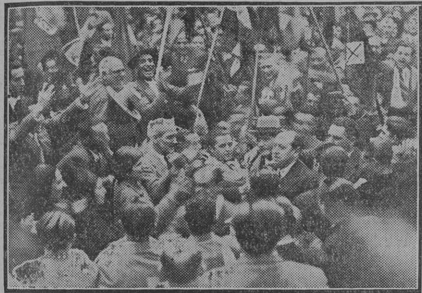
El Sr. Gil Robles á su llegada al Frontón Betis.

Desde el Frontón Betis el señor Gil Robles se trasladó seguidamente al teatro de la Exposición.