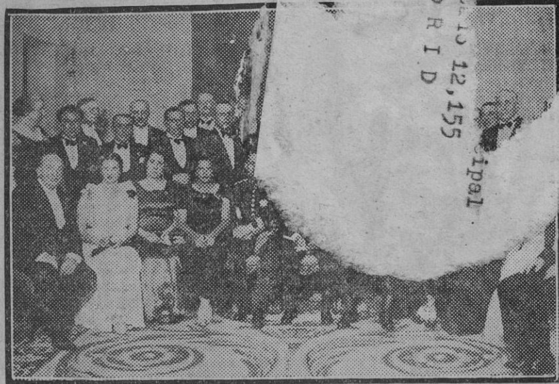
Las autoridades, miembros del Congreso americanista y otros invitados a la comida de gala celebrada anoche en el palacio de la plaza de España.

Lo pintado, sin exageración, lo conocen los sevillanos todos; los sevillanos, principalmente, que tienen próxima una vecindad infantil, bulliciosa y desaprensiva. La sensibilidad edilicia debía sentirse herida y buscar la manera de que tales desafueros fueran evitados y corregidos.