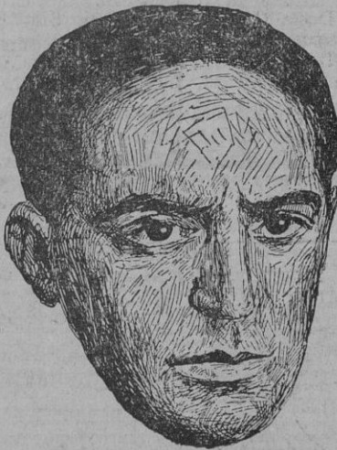
El ilustre doctor Marañón, nombrado hijo adoptivo de Sevilla en el Cabildo celebrado hoy.

Serán se nos informa, el profesor Uhle trae publicado un trabajo especial que ofrecerá al Congreso, bajo el título «Las civilizaciones