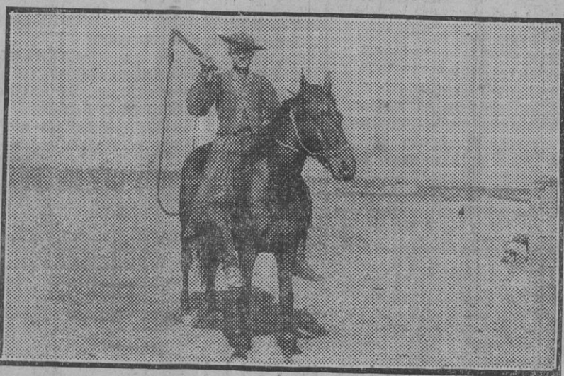
El pastor húngaro, como buen jinete y en destreza, no se queda atrás del gauchó. Representa el grabado un joven pastor magyar, guarda de yeguada en las landas de Hortobagy. Al fondo se distingue la inmensa llanura húngara, en donde tan magníficas cualidades de raza han podido adquirir los equinos de aquel país.