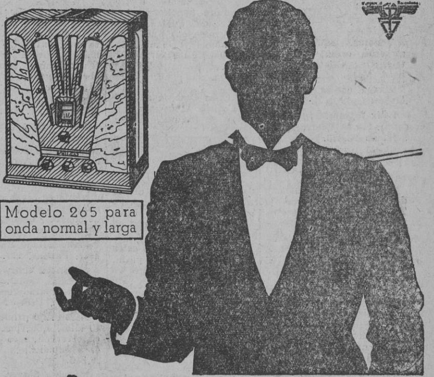
Modelo 265 para onda normal y larga