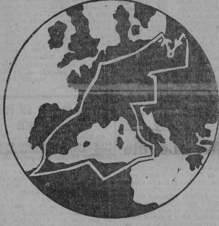
Gráfico del recorrido de los aviones

Sevilla figura en el itinerario con la etapa número 9, y los aparatos aterrizarán en Tablada el sábado y el domingo próximos