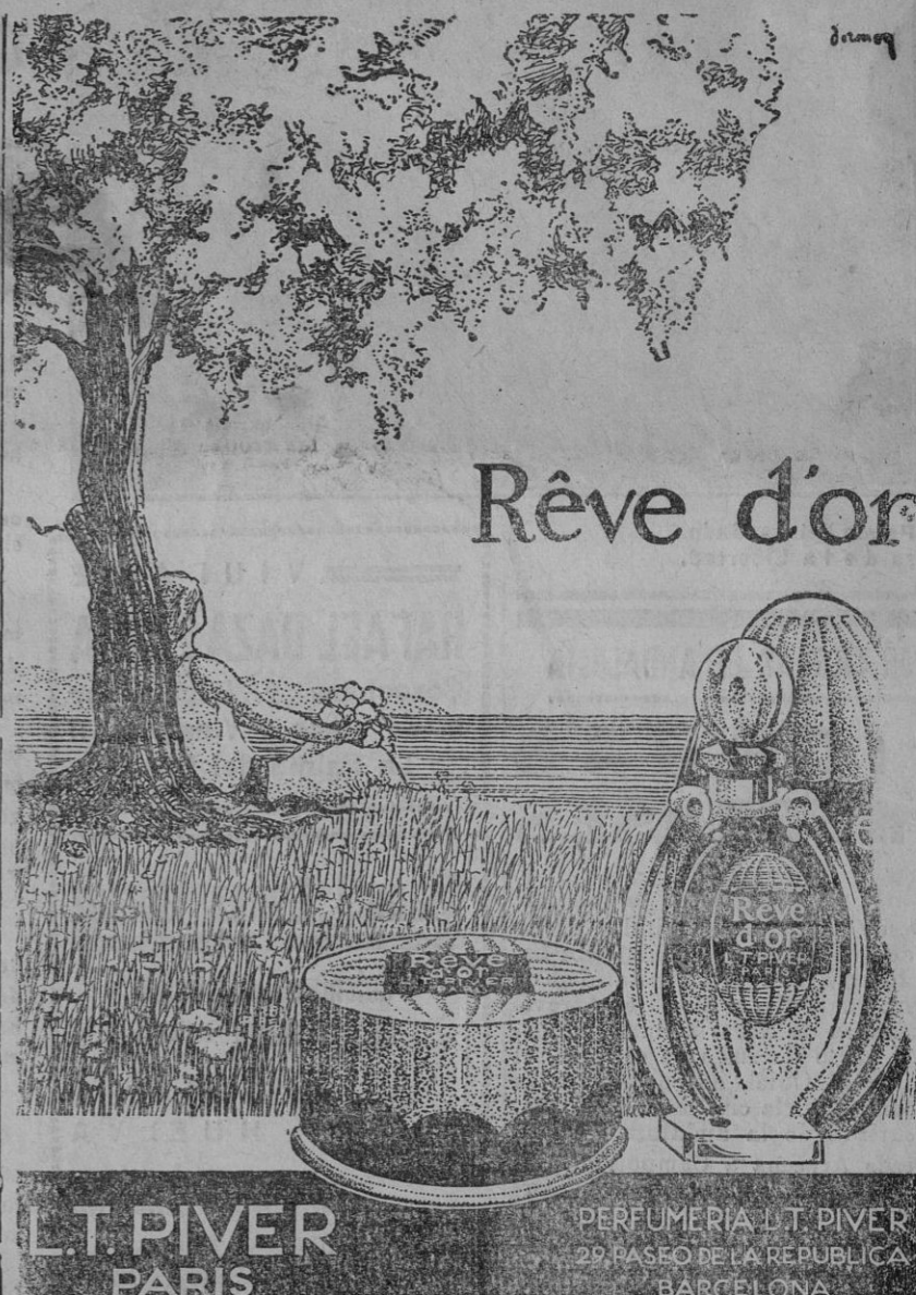
PERFUMERIA L.T. RIVER. 29, PASADU DE LA REPUBLICA. BARCELONA.