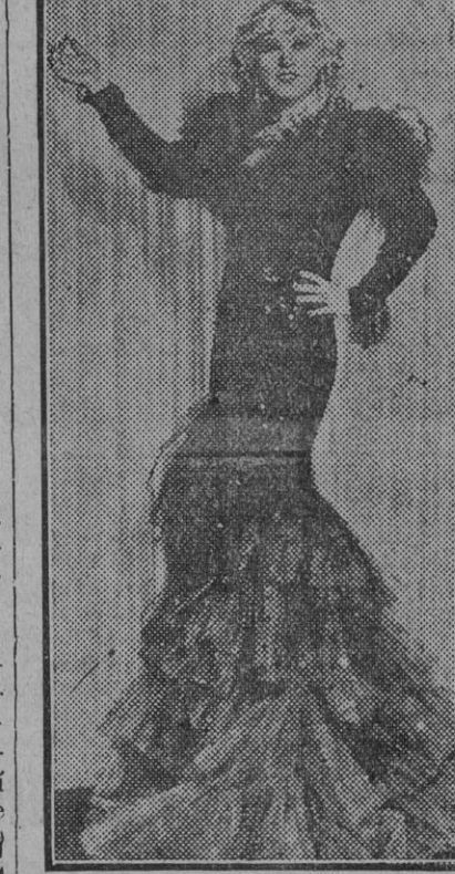
Mae West, elegante actriz del cine americano

das, emblemas decorativos y cantidad considerable de antenas presas. Anejos al edificio y comprendidos en el plan general, se hallan departamentos espaciosos, en los que se atiende a distintos servicios: restaurantes, tertulias etc. El espectador adinerado halla allí todo género de facilidades. Pasillos especiales conducen a la sala de espectáculos, y mediante un módico estipendio a los cuartos de los artistas. Por lo general, y en atención fidelísima a la gran misión artística, educativa y social que se asigna al teatro, los edificios teatrales del Japón son lugares de distinción y de lujo, que ya desde el júbilo palpitante de los mil aditamentos de la fachada, pretenden atraer la atención del ciudadano. Muchas veces, una gentil y abigarrada comparsa emerge del edificio, y por las cercanías realiza con estrépito y eficacia el reclamo adecuado. Interesantísima por modo extraordinario y curioso es una representación teatral japonesa. L. González Díez. Sevilla 12-VI-34.