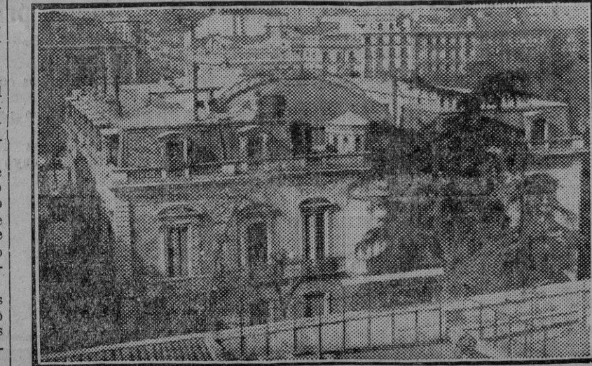
MADRID.—El palacio de Manzanares, donde será instalado el Tribunal de Garantías.

Esta misa tendrá lugar en la iglesia de los Venerables el día 28 del corriente mes, a las diez y media de su mañana.