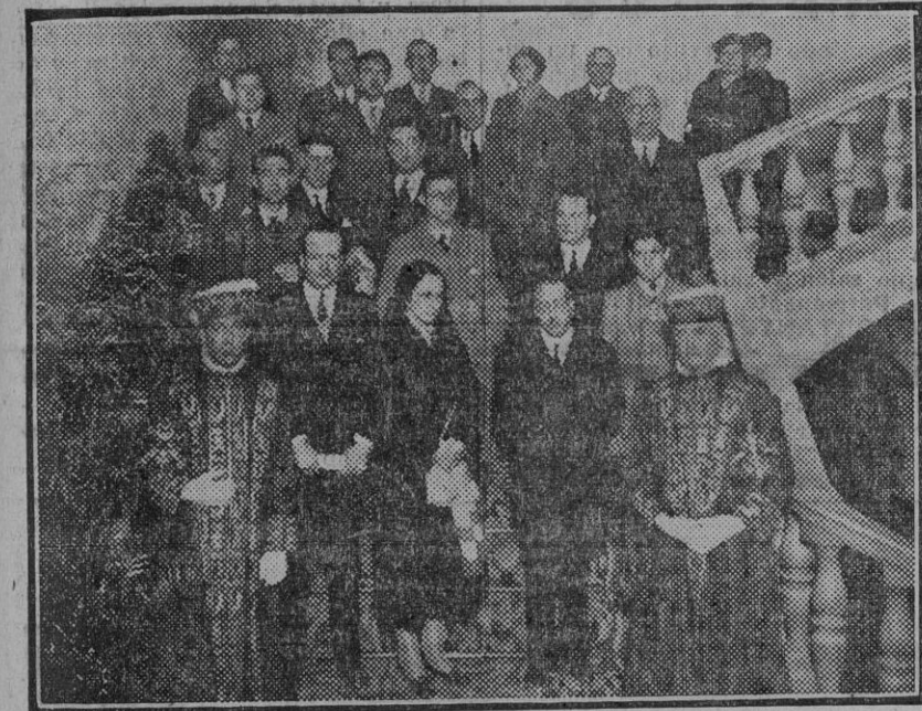
El ilustre inventor del autogiro en la recepción municipal celebrada en su honor.

Para mañana, a la una de la tarde, ha sido nuevamente citada la Comisión de Cementerio.