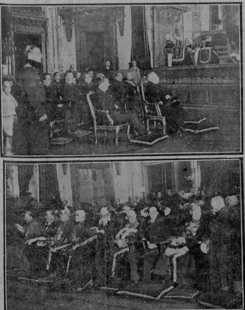
Funerales por el rey de Bélgica celebrados en Madrid, en la Catedral primada, con asistencia del Presidente de la República española y el Cuerpo diplomático acreditado.—S. E. y el ministro de Estado al frente de la representación oficial española en dicho acto y el Cuerpo diplomático durante la ceremonia.