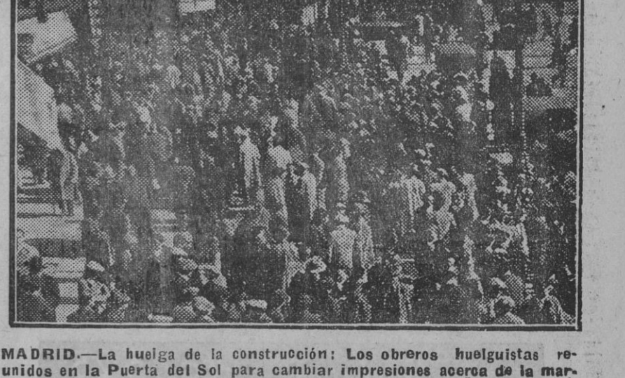
MADRID.—La huelga de la construcción: Los obreros huelguistas reunidos en la Puerta del Sol para cambiar impresiones acerca de la marcha del conflicto.