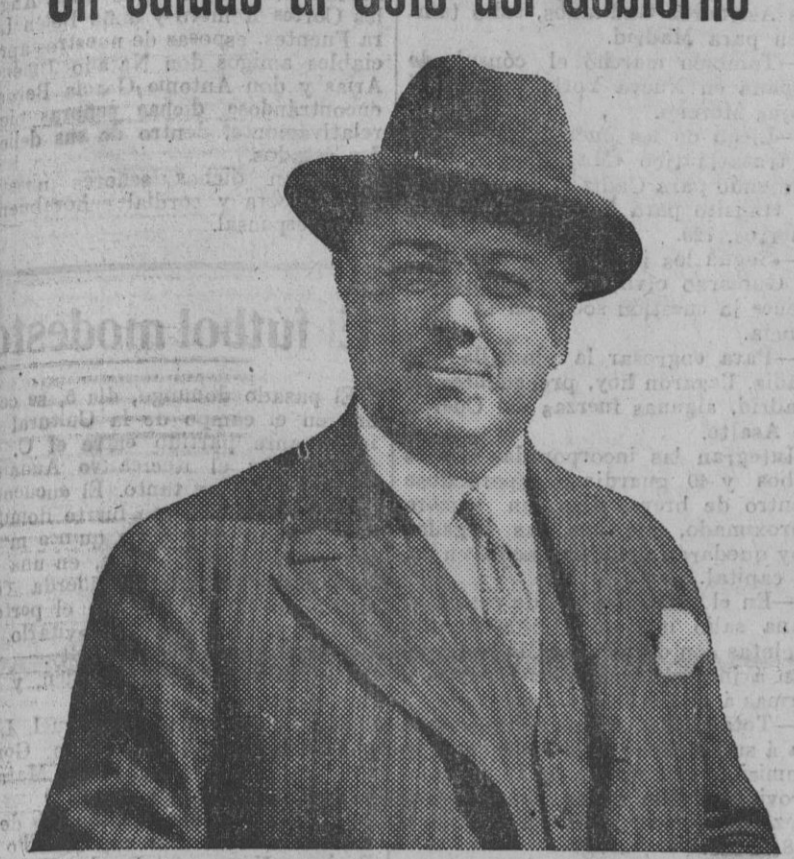
A Sevilla, que, si no recordamos mal, desde los tiempos del primer conde de San Luis, hasta hoy no había tenido ninguno de sus hijos en el puesto cumbre de la Presidencia del Consejo de ministros, cuando llega a esta ciudad por primera vez ocupando este puesto el señor Martínez Barrio, cúmplice el deber de expresar el testimonio de afectuosa salutación.

El señor Martínez Barrio presidió el Cabildo municipal, cambiándose afectuosos discursos entre el Alcalde y el Presidente del Consejo La recepción fué en extremo cariñosa y popular, concurriendo extraordinario número de personas Un saludo al Jefe del Gobierno