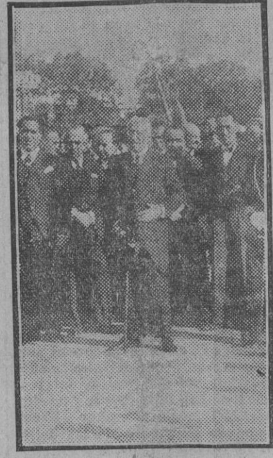
El Presidente de la República y los ministros en la presidencia del dueto