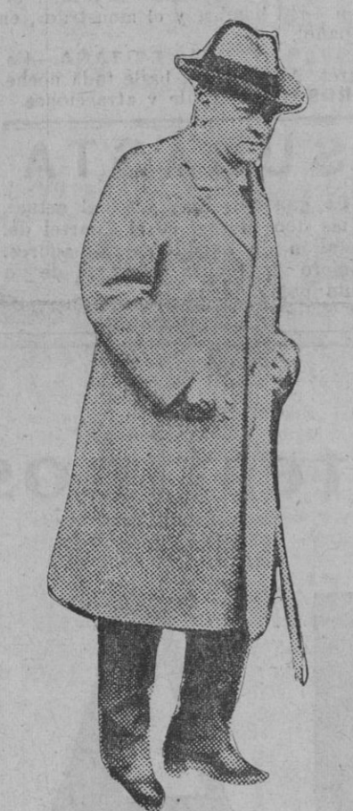
Stresemann previó que sólo en la paz podía llevarse a efecto la magna obra de la reconstrucción material y espiritual de Alemania, tan necesaria a su vida.

Durante la tarde la situación en el Puerto ha continuado siendo idéntica a la de la mañana, según nos informan.