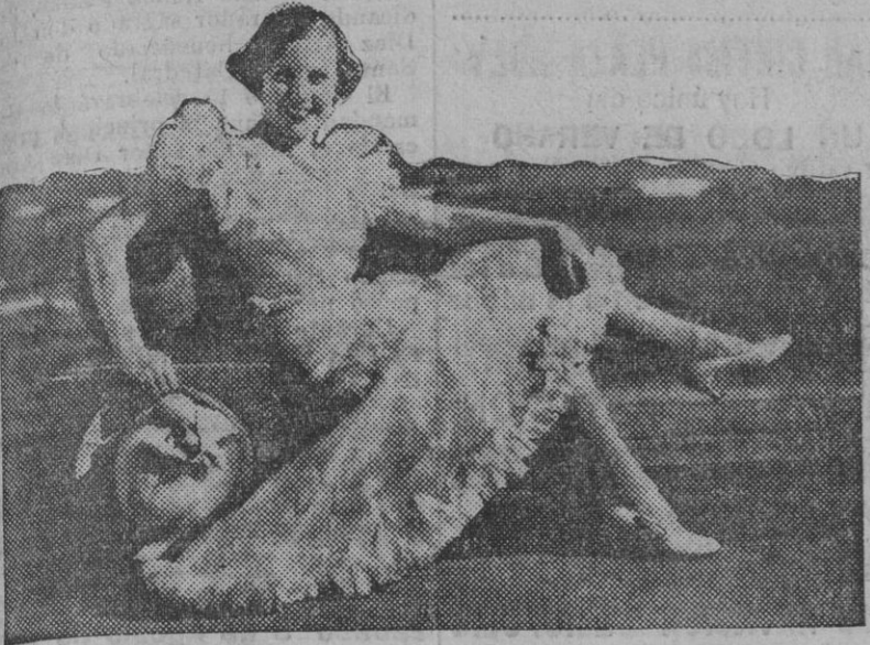
La linda estrella española Rosita Diaz Gimeno.