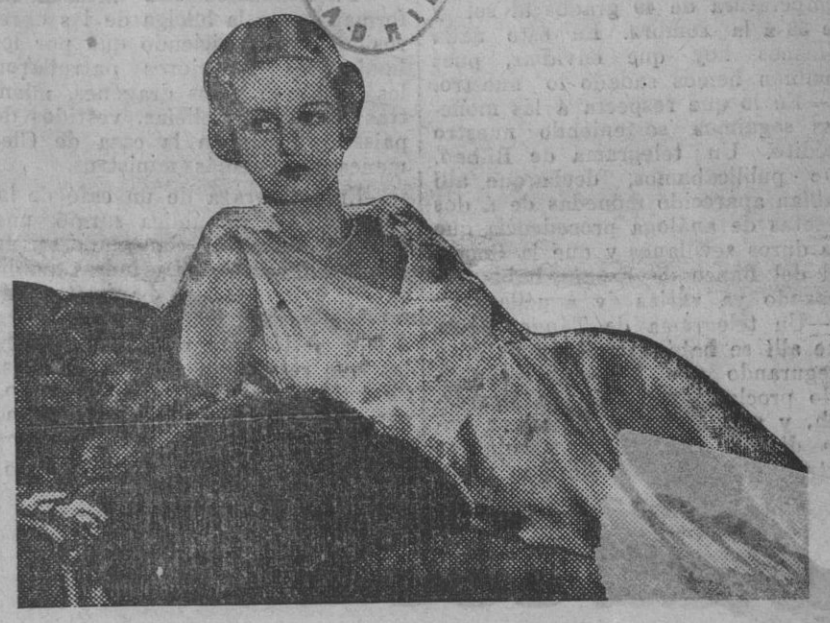
Joan Bennett, destacada estrella americana

a ellos les ha hecho perder todo lo que ganaron, en un derrumbamiento de posibilidades y ha llevado a la desesperación a las masas obreras, para las cuales se acabó el trabajo mucho antes de que pudieran darse cuenta de la tragedia? Todo ha sido luego una disputa de excesos, de incompatibilidades. En la confusión han dejado de entenderse unos y otros.