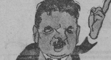
Herriot es el continuador de la obra iniciada en Locarno por Briand y Stresemann. No ignora que sobre la República francesa pesa hoy una nube negra, más difícil de disipar que la de 1914.