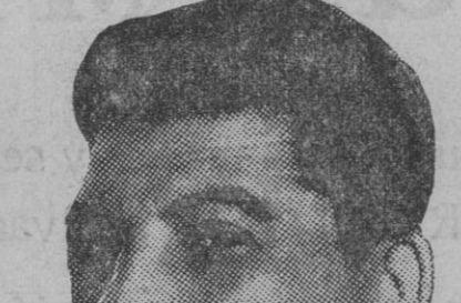
Stalin, con su Ejército rojo, que según técnicos es uno de los más formidables ejércitos modernos, es otra inquietud viva para la paz del orbe.