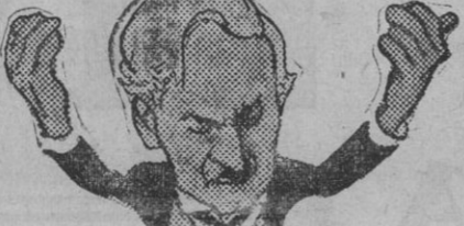
Macdonald, el tan combatido político inglés, es un pacifista sincero, que actúa por amor a la paz y por el convencimiento de que sólo el pacifismo puede detener la disolución del Imperio Británico, que vive actualmente horas muy difíciles?