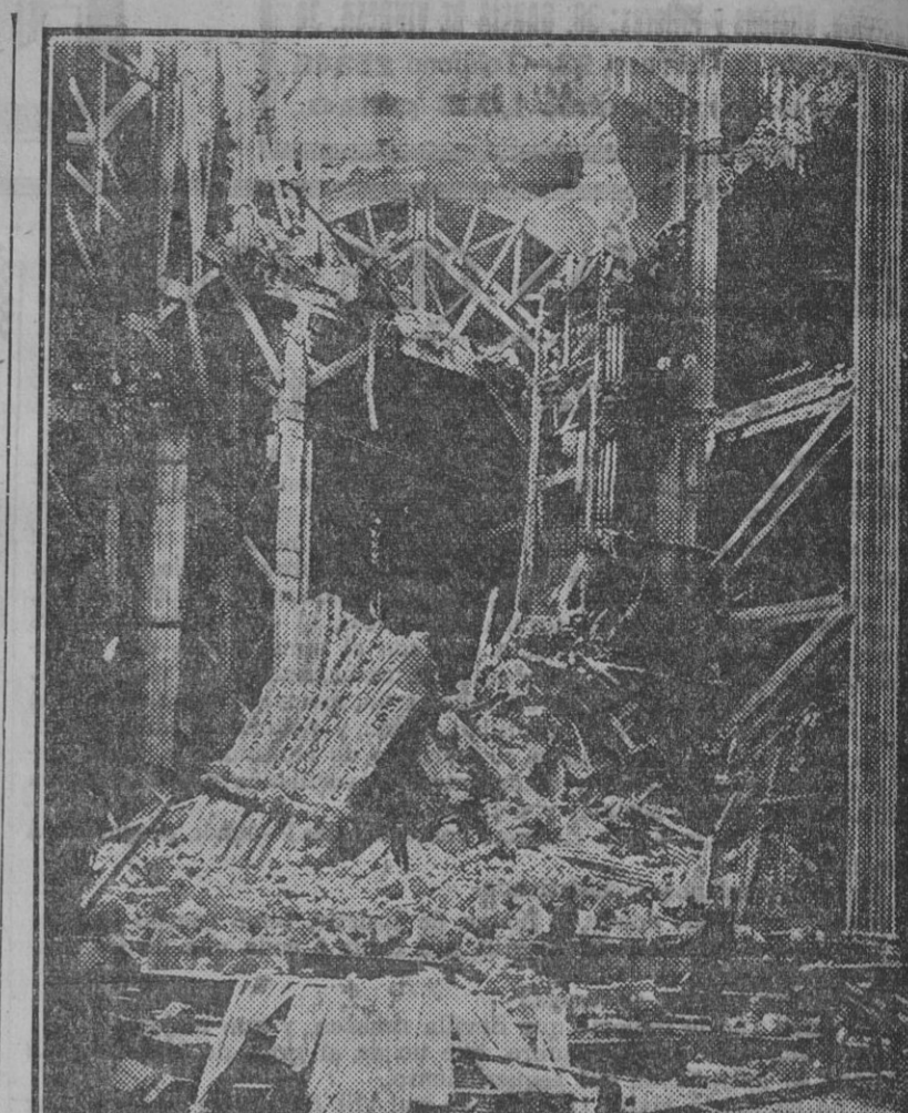
Curiosa y única fotografía de conjunto que se conserva del hundimiento de la Catedral