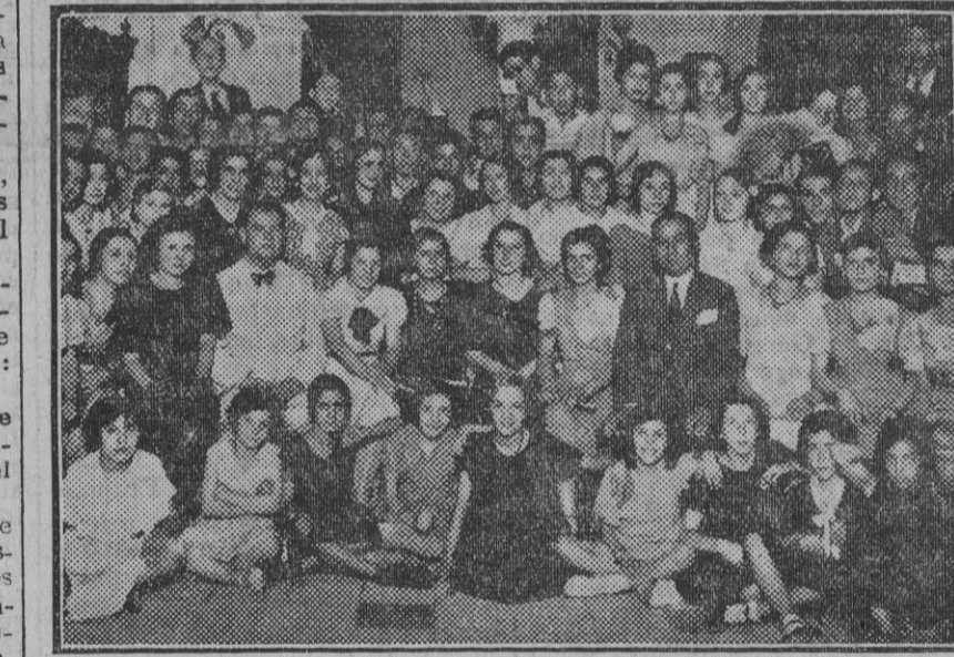
Reparto de premios a los alumnos de las clases especiales del Centro Mercantil, verificado anoche.

Si la fatalidad llega a robarlos al homenaje triunfal de Méjico y de España, no habrá logrado ni opacar su gloria, ni disminuir el éxito