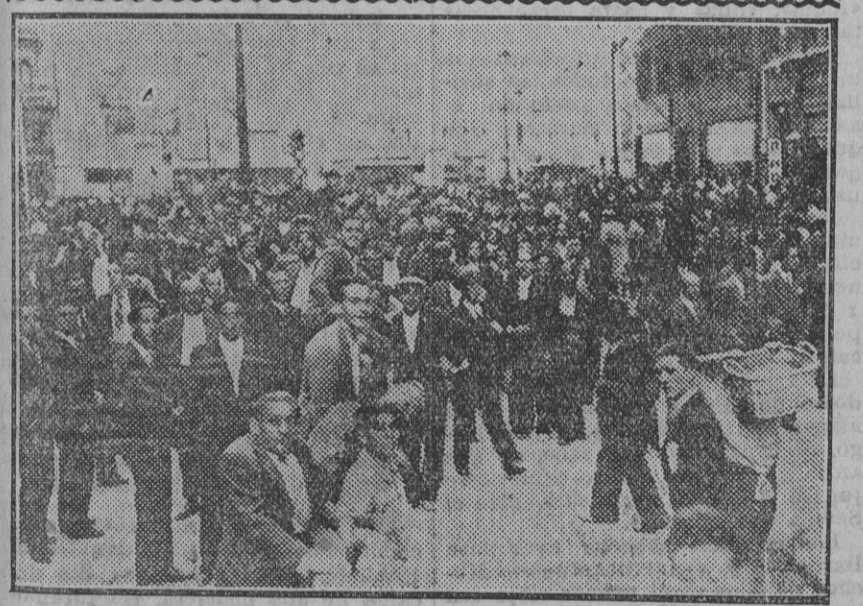
El público ante el Aero Club de Madrid en espera de noticias de los aviadores.

París.—Los diarios participan de la inquietud que ha determinado en todo el mundo la desaparición de los aviadores españoles Barberán y Collar.