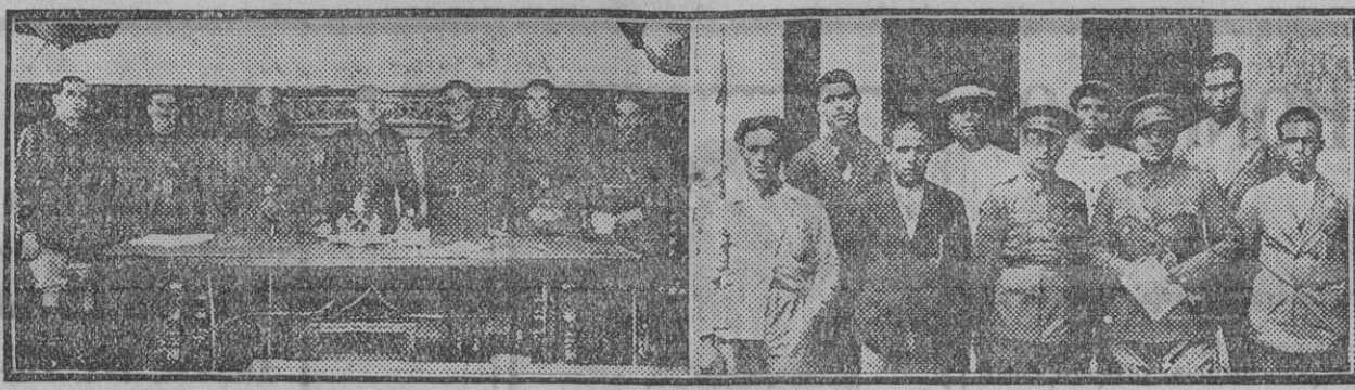
El tribunal y los procesados con sus defensores