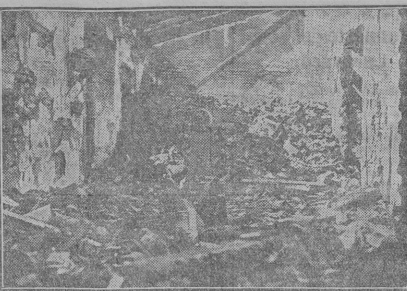
Estado en que quedó el taller de maquinarias de la fábrica de corcho que anoche fué destruida por un incendio (Foto Sánchez del Pando.) (Fdo. Gori)

¿Qué debía temer, siendo inocente? El delegado llamó. El magistrado Leicardi abrió la puerta. Los dos hombres cambiaron algunas palabras en voz baja, y después el delegado se dirigió a Lorenza, diciendo: —Venga usted!