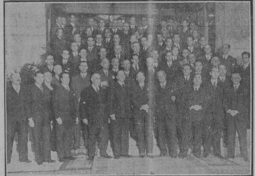
MADRID.—Asistentes al banquete celebrado por la Asociación Nacional de Ingenieros Agrónomos para festejar el aniversario de su fundación.