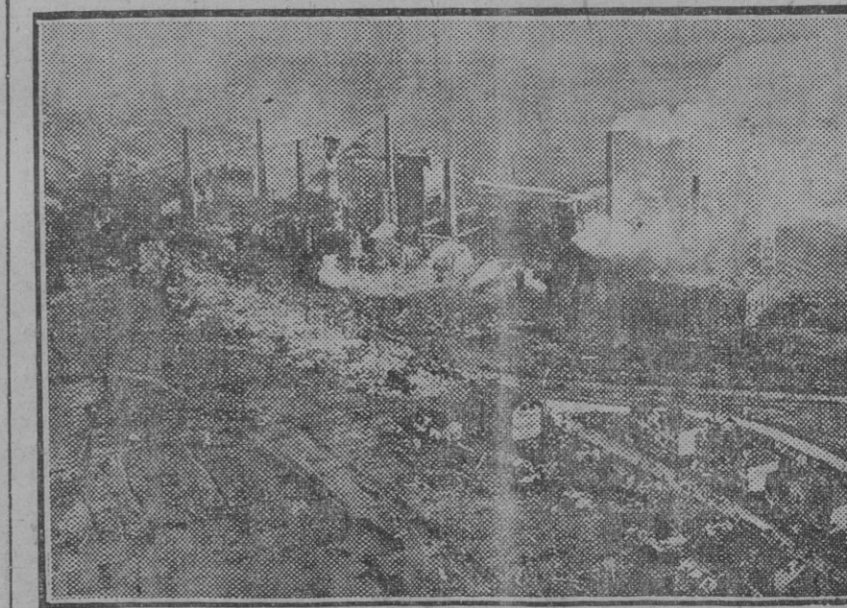
LA CATASTROFE DE NEUNKIRCHEN.—Aspecto de las ruinas de la ciudad.