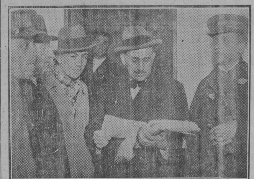
MADRID.—El Juzgado especial por los sucesos del 10 de Agosto durante las diligencias de reconstrucción de los hechos en el cuartel de la Remonta.

En el temperamento español el impuesto resulta insostenible. ¡Custan tanto el vuelo de las campanas á rebato, el toque de somatén y el repiqueteo de esquilas y esquilones en las grandes ceremonias!