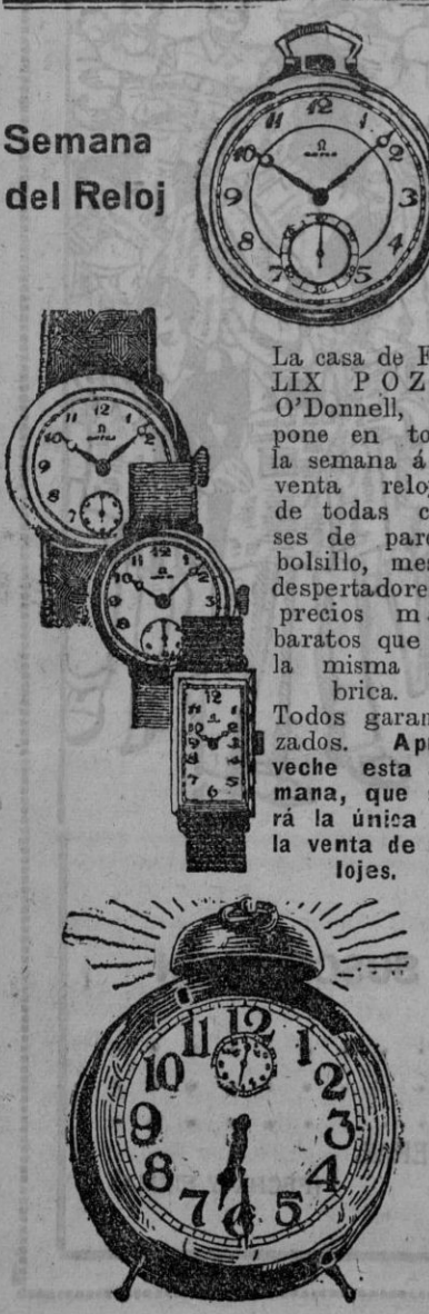
Semana del Reloj

Albareda, 50-SEVILLA-Teléfono 23.372 Envíe por Giro postal el importe de su pedido, y se lo expediremos seguidamente.