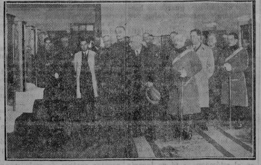
Madrid.—El señor Alcalá Zamora vió uno de los dormitorios de la Escolta presidencial.