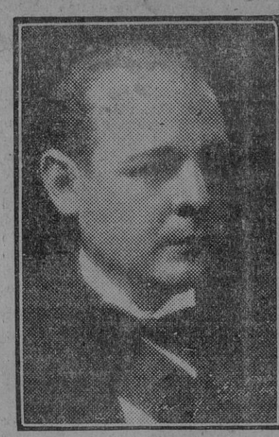
ocupar tan elevado cargo, pues el postulado de la Revolución se opone a ello con su «no reelección» de los Presidentes, senadores, diputados y gobernadores de los Estados, ni aun mediando un período intermedio.

«Los hombres que fundaron la República, y que actualmente la gobiernan, tienen una amplia preparación política para llevar adelante