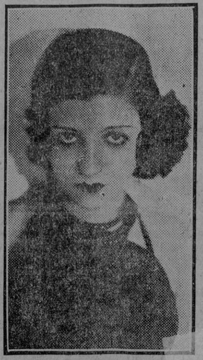
Pilar Galvo, la joven estrella del baile español, que después de una triunfal gira por América del Sur, se encuentra de regreso en España.