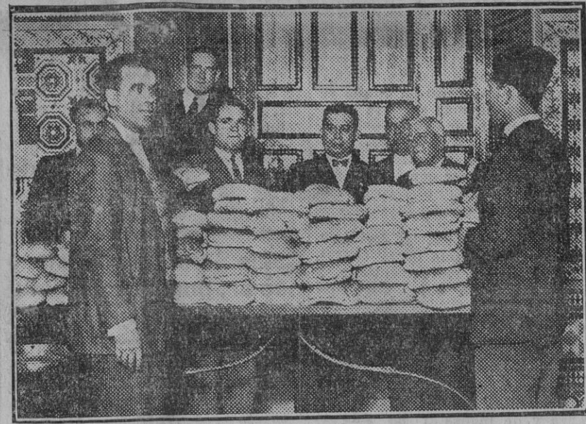
Uno de los despachos del pan traído de Huelva y Córdoba con motivo de la huelga y que el delegado señor Romero Llorente ha instalado en una de las tenencias de Alcaldía. (Fdo. Gori.)