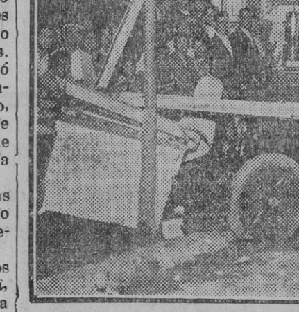
El coche causante del accidente y lo que quedó en pie del puesto de aguas.

Esta mañana se supo en el Juzgado quién era el individuo que