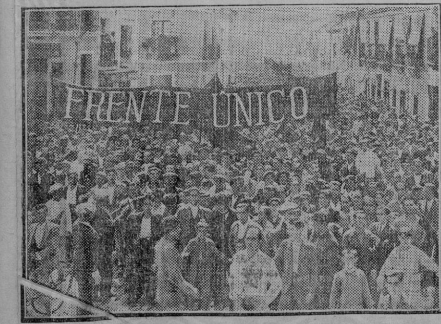
Manifestación comunista de ayer al pasar por la calle Fermín Galán (San Bernardo).

Como no podían llegar trenes, la correspondencia se enviaba a Málaga desde Almería en vapor. En la estación de Alora estaban detenidos cinco trenes de viajeros y dos de mercancías.