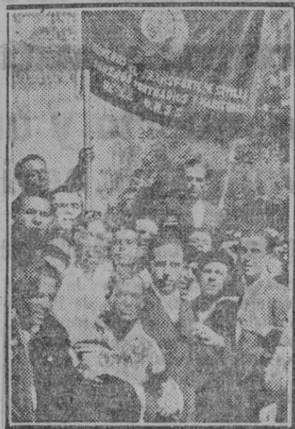
La bandera que regalaron los obreros del Transporte de Rusia a sus compañeros de Sevilla, al desfilar en la manifestación.

Le sucede en la palabra el camarada García, por el Sindicato de metalúrgicos. Manifiesta, en términos elocuentísimos, la adhesión de los camaradas que representa al acto que organiza la U. L. S., y, como los anteriores oradores, insiste en la necesidad de terminar con dichas actitudes de ciertos elementos que se llaman revolucionarios. Al levantarse para hablar Satur-