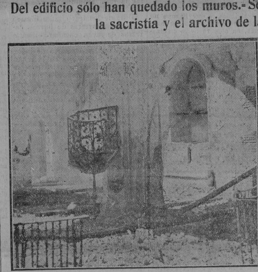
Vista del interior de la iglesia de San Pedro, desde el presbiterio.

Ya cerrada nuestra edición última recibimos la noticia de haberse declarado un violento incendio en el parroquial del pueblo de Aznaalcázar.