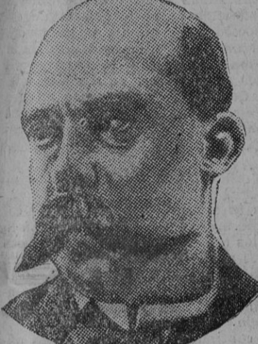
Acaso hoy, en que aquella fecha parece tan lejána, no se apreciar en toda su intensidad lo que

Emilio Castelar, para el mundo entero no es más que aquel ministro de Estado del Gabinete de Figueras que hiciera realidad el noble ansia del pueblo español de abolir la esclavitud en sus territorios coloniales.