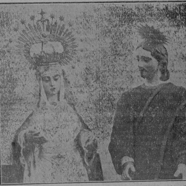
Nuestra Señora de las Angustias, patrona del pueblo, y San Juan Evangelista, esculturas de Montañés, destruidas por el incendio.

El edificio de lo que fué iglesia sólo quedaban en pie los muros ennegrecidos. Todo cuanto había dentro de aquél había sido totalmente destruido.