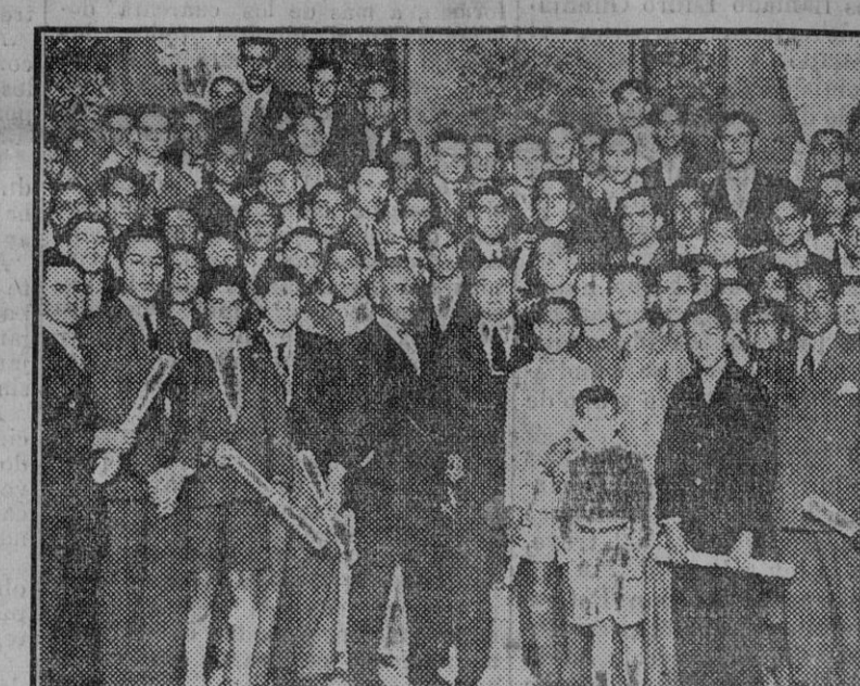
Reparto de becas a los alumnos de la Escuela de formación profesional.

Dentro del orden, los obreros todos, absolutamente todos, tienen abiertas las puertas de mi despacho para recibirlos, escucharlos y atenderlos con el mayor cariño y consideración.