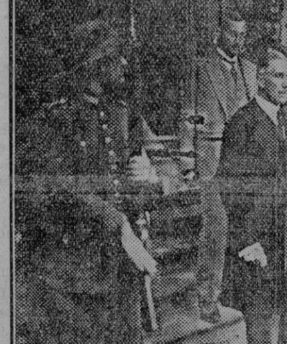
El nuevo Gabinete alemán en la sala alera del Palacio Presidencial al salir de prestar juramento. De izquierda a derecha: Von Papen, canciller; von Neurath, Negocios Extranjeros; y en segundo término, en igual orden, von Geyl, ministro del Interior; von Braun, ministro de Agricultura y Alimentación; doctor Günter, ministro de Justicia; general von Schleicher, ministro de la Guerra; y doctor Warmbold, Economía Nacional.

El agresor huyó, ignorando el herido si ha sido o no detenido.