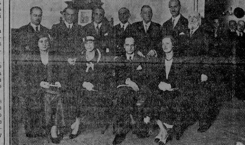
En la Academia de Medicina y presida por el ministro de la Gobernación, señor Casares Quiroga, se inauguró el pasado lunes la Semana de Higiene Mental, organizada por la Liga Española de Higiene Mental.

Para gobernar necesitan del apoyo de los diputados independientes, que tienen cinco puestos.