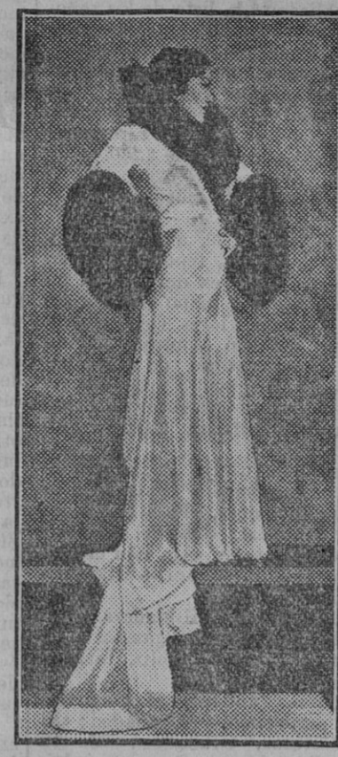
Gloria Iwanson, la más elegante de las actrices americanas