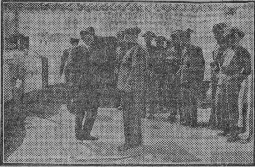
Comandante de puesto y fuerzas que han intervenido en el descubrimiento de los explosivos. Osa número 2 de la calle Campana.