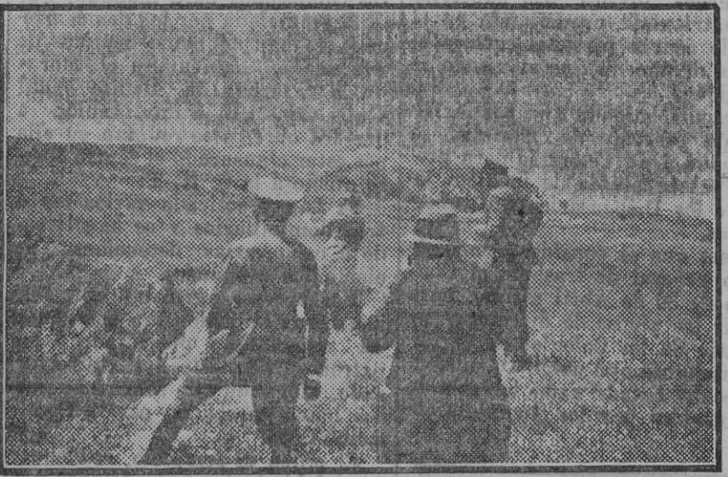
Momento de lanzar una granada para su explosión.

Las detonaciones, formidables, fueron oídas a gran distancia.