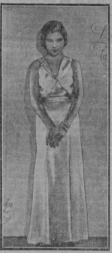
Lilyan Tashman, que luce un modernísimo pijama de su invención