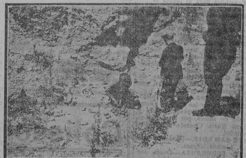
Varios de los explosivos preparando los un artífice a fin de hacerlos desaparecer.

Esta preocupación se refleja de modo ostensible en el retraimiento de los vecinos, que acuden en muy escaso número a los establecimientos y a los cines.