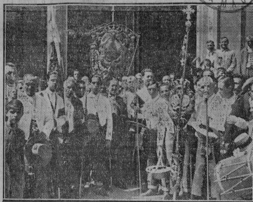
La Mesa de la Hermandad del Rocío trianera, a las puertas del templo. (Fotos Sánchez del Pando.) (Edo. Gori.)