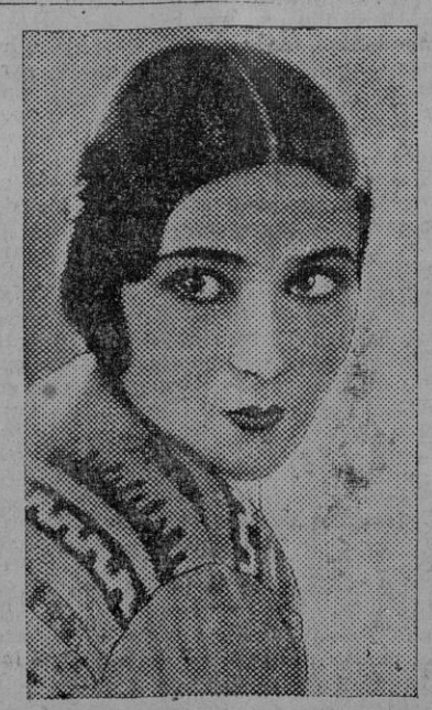
Dolores del Río, la más brillante del arte mejicano.