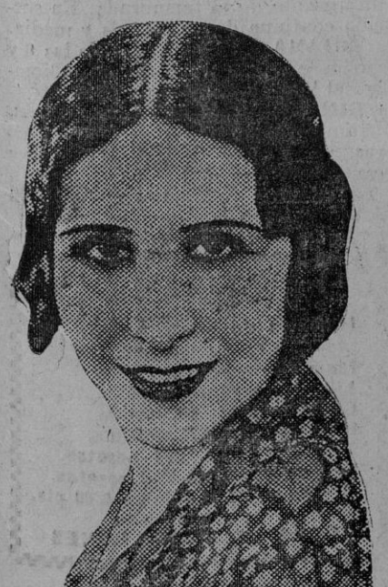
Amelia Muñoz, destacada actriz del cine español.