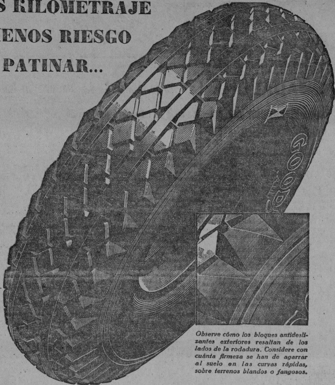
Observe cómo los bloques antideslizantes exteriores resaltan de los lados de la rodadura. Considere con cuánta firmeza se han de agarrar al suelo en las curvas rápidas, sobre terrenos blandos o fangosos.

Cuando Goodyear produce algo nuevo, significa que produce algo mejor. Así, por ejemplo, el nuevo y perfeccionado neumático de rodadura All-Weather aventaja de manera notabilísima a su justamente famoso predecesor.