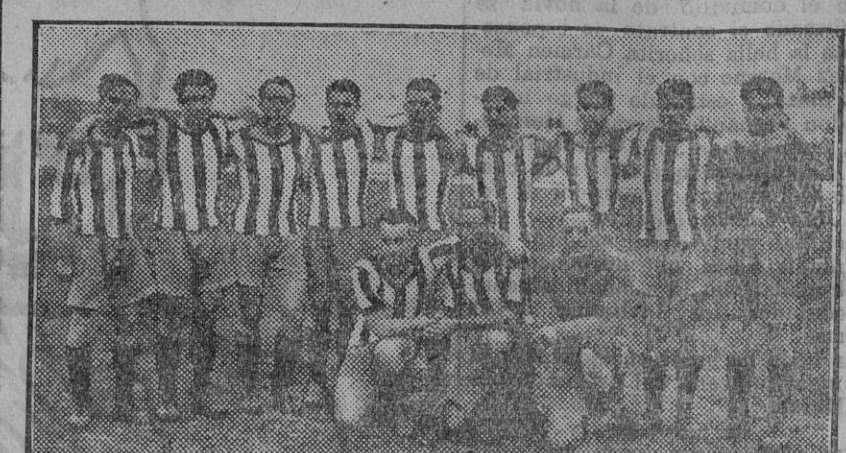
El equipo del Spórting Club de Gijón (Foto. Sánchez del Pando).