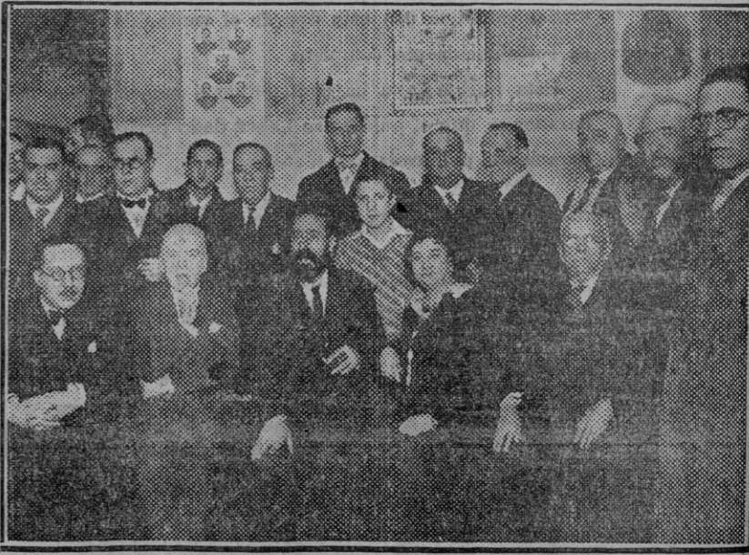
MADRID.—Conmemoración de la primera República española. En la Casa de la República se celebró solemnemente el LIX aniversario de la proclamación de la República el 11 de Febrero de 1873. Nuestra fotografía muestra a los oradores y algunos asistentes al acto. (Foto Agencia Gráfica.) (Fdo. Gori.)

Sobre la reapertura del Hotel Municipal : Igualmente dijo que había celebrado una reunión con el alcalde de Sevilla, señor González y Fernández de la Bandera; el señor Gaspar y el director del Hotel Municipal, agregando que parece que se podrá llegar a una rápida solución que, a la vez que beneficia al Ayuntamiento, permita la reapertura inmediata del referido hotel. El Sr. Sol marchará mañana a Constantine para asuntos del laboreo de tierras : Asimismo manifestó la autoridad gubernativa que mañana, por la mañana, y en unión del ingeniero jefe de la Sección Agronómica, se trasladará a Constantina, pues desea comprobar personalmente las denuncias recibidas acerca de la situación de determinadas e importantes fincas que, según aquel Ayuntamiento, y los obreros, no se realizan en ellas trabajos de ninguna clase, dispuesto a no permitir desmanes de los obreros, tampoco tolerará que algunos propietarios se colocoquen en una actitud improcedente. Agregó que aprovecha esta ocasión para hacer resaltar que va a ocuparse de cuanto se relaciona con