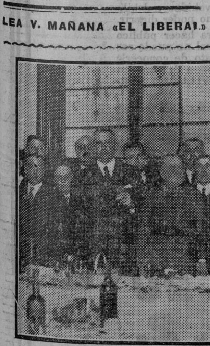
Presidencia del banquete que, organizado por el alcalde, se celebró ayer tarde para conmemorar el aniversario de la proclamación de la primera República española. (Foto. G. del Pando.) (Fdo. Gori.)