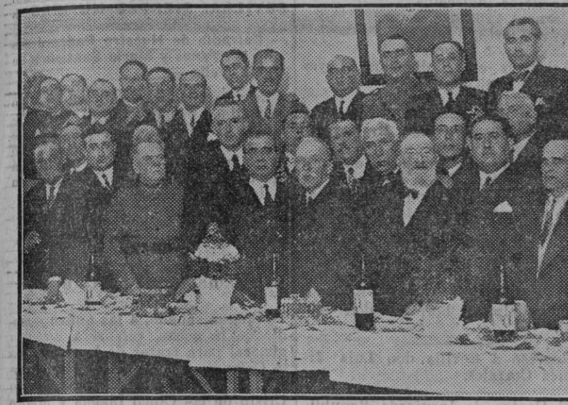
Autoridades y personalidades que asistieron en la mañana de ayer al acto celebrado en el Centro Cultural de Izquierda Republicana, conmemorativo de la fecha del 11 de Febrero. (Foto. Sánchez del Pando).

Que la sección naval de la Conferencia del Desarme vuelva a examinar este problema desde la base! No logramos persuadir a las potencias en 1930; ¡Ojalá 1932 nos sea más propicio, y se llegue a una decisión tan justificada por todos conceptos!