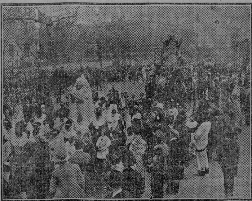
El Carnaval en Madrid: Aspecto del paso de la Castellana a la llegada de la cabalgata del Ayuntamiento.

El despacho de referencia dice que en vista de la riqueza de los hallazgos, la expedición continuará sus excavaciones durante mucho tiempo, pues constantemente salen a la luz ruinas de antiguos palacios y otras edificaciones, algunas de las cuales dan una idea muy aproximada de la organización comercial de tan lejanas épocas.