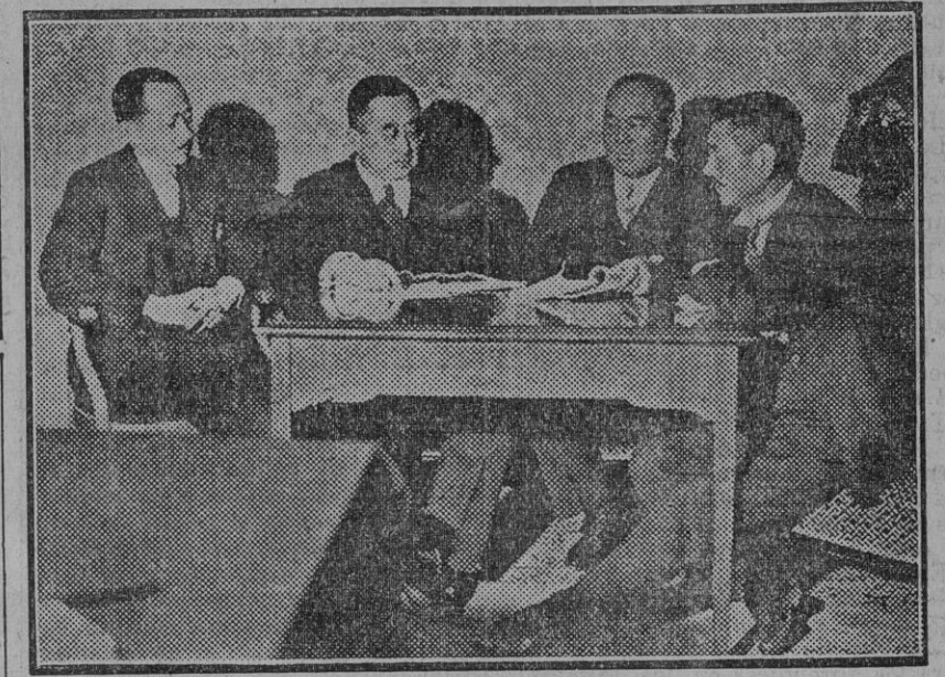
Los japoneses discuten la situación en Ginebra, mientras China y Japón están librando sangrientas batallas. Ambos países toman parte en la Conferencia del Desarme universal. La foto muestra la delegación japonesa discutiendo la situación en el hotel donde se hospeda en Ginebra.

También ha recibido a otra Comisión de obreros pintores y petición de que se reforme el estado interior de los edificios municipales en lo que se refiere a este ramo, con objeto de que se les proporcione trabajo.