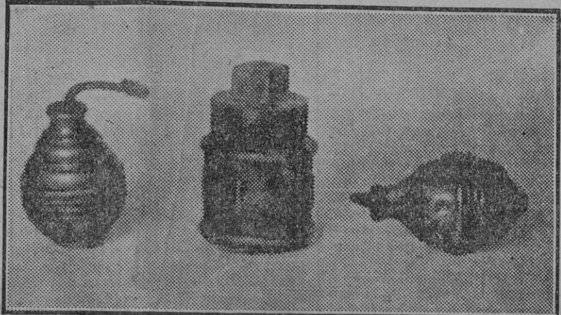
Los tres explosivos encontrados por la Guardia civil