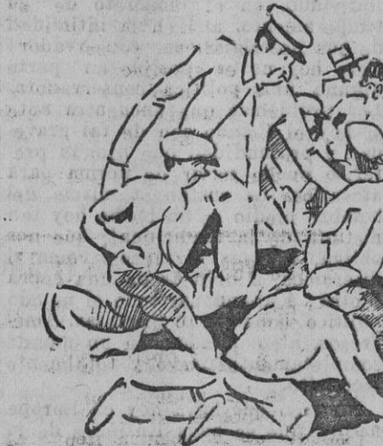
Un inesperado partido de «rugby» entre empleados y chavalería cuando aquellos querían recoger los balones.