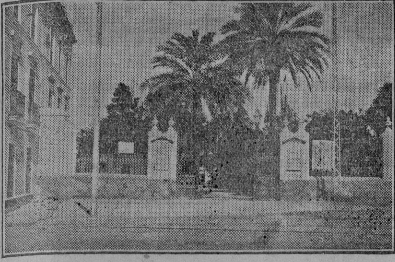
EL TEATRO ESLAVA

Hace veintiocho años se hizo esta fotografía que ves, lector. Esa era la puerta—una de las puertas—de los jardines de Eslava, juvenicos de pelo ondulado. Tenía el precioso teatro otra puerta por la calle San Fernando, cercana a la hoy hermosa calle del Foso.