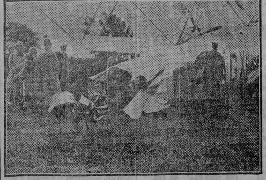
La terrible catástrofe ocurrida al avión gigante «Hannibal», que había el recorrido desde Croydon á París con ocho pasajeros. La fotografía muestra el aparato después del desastre. (Fdo. Gori.)

En otro cortijo denominado «El Fresno», término de Arahal, propie-