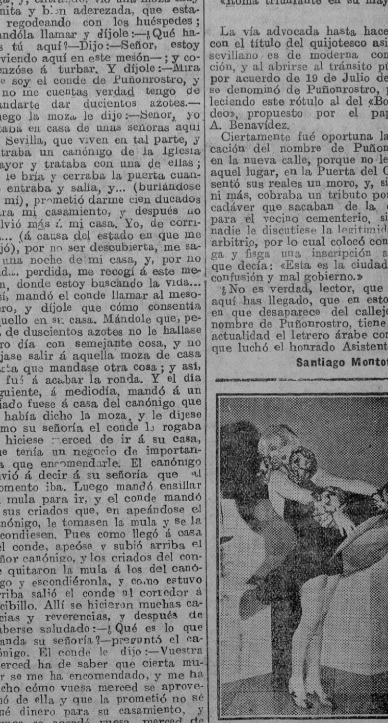
Anita Page, la linda actriz de la pantalla, y su muñeca, lucen los mismos vestidos... y procuran parecerse entre sí tanto como sea posible.