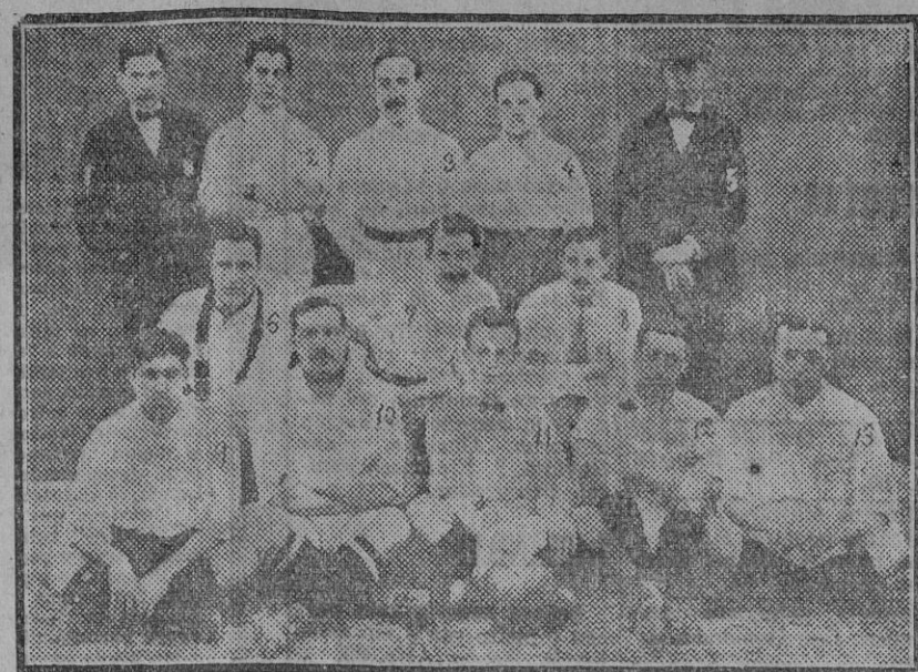
EL «FOOT-BALL» EN SEVILLA