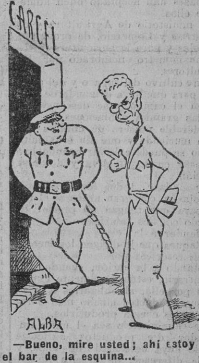
—Bueno, mire usted; ahí estoy en el bar de la esquina...