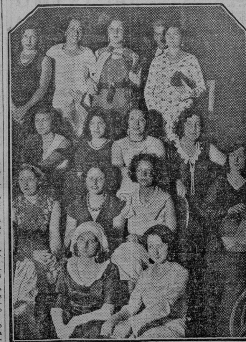
MADRID.—Grupo de señoritas que se presentaron al concurso de belleza organizado para elegir «Miss Aviación».

LEA USTED MAÑANA «EL LIBERAL» EL DIARIO MEJOR INFORMADO