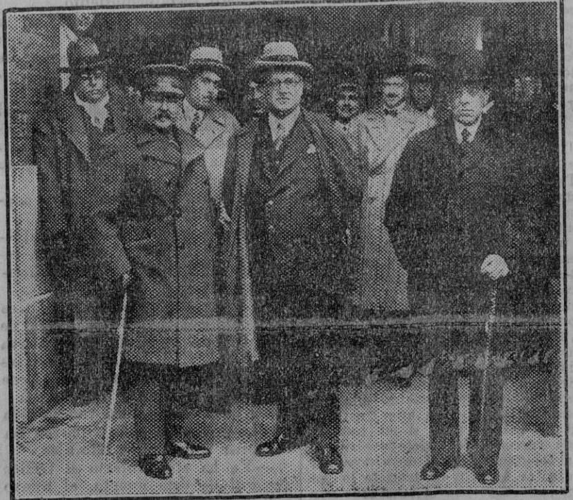
El nuevo gobernador civil, don Vicente Gimeno, á su llegada á Sevilla

Las conferencias del P. Laburu Las conferencias religiosas que viene dando el padre Laburu tendrán lugar esta noche en la iglesia del Sagrado Corazón de Jesús.