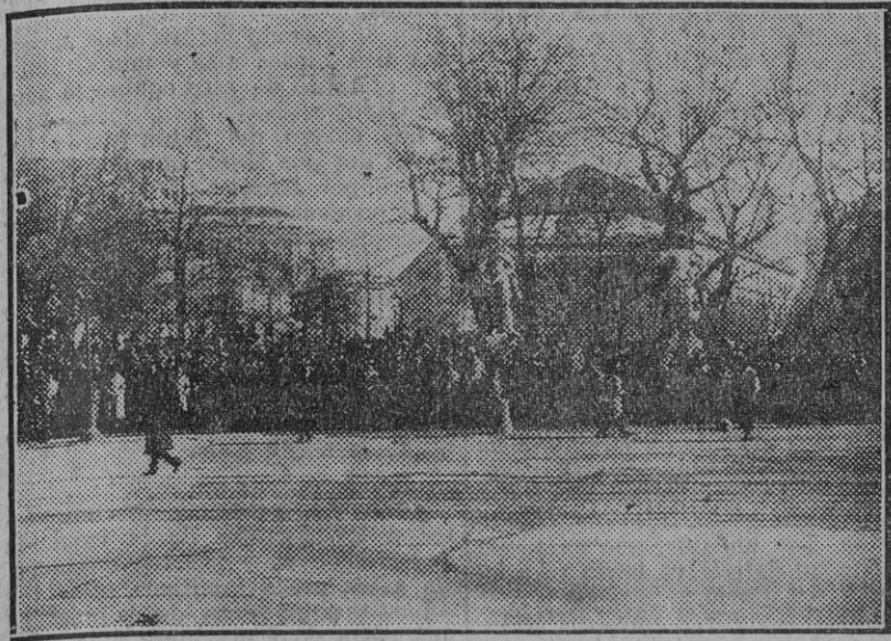
El público estacionado ante Palacio para saber por las referencias de los reportéres el curso de los acontecimientos políticos.

Al cuarto día de planteada continúa aún sin resolver.— Sánchez Guerra ha declinado el encargo de formar Gobierno.