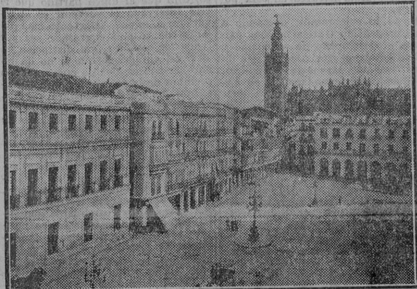
UNA FOTO MUY VIEJA

Tiene esta fotografía de la plaza de San Francisco más de cuarenta años. No tiene aún instalada la vía del tranvía. Parece mucho mayor la plaza que lo es en la actualidad. En el centro de la plaza existían tres hermosos candelabros, con ocho mecheros de gas. La mayoría de los coches son jardinerías y coches para caminos, con cuatro caballos. En la esquina de los portales donde estuvo la taberna del Cabo Naval existía por aquella época un almacén de curtidos y cortes aparados.