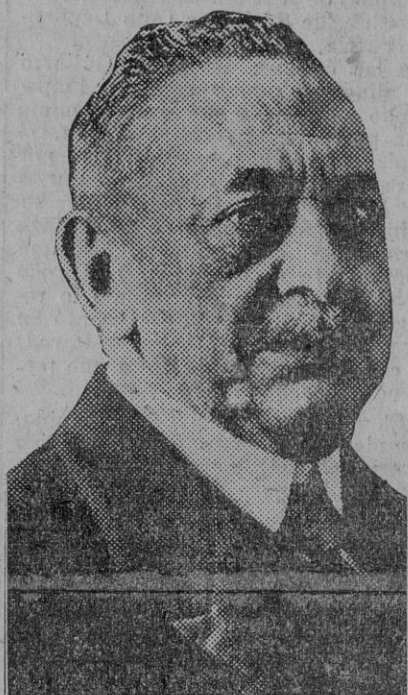
El marqués de Alhucemas, á quien á última hora han logrado convencer para que acepte una cartera en el Gobierno de concentración monárquica.

decía que iba á ser llamado á Palacio el general Saro. Al oír esto el conde de Maceda, poniéndose las manos en la cabeza, dijo: —Pero qué cosas se dicen! Vaya, señores, hasta luego.