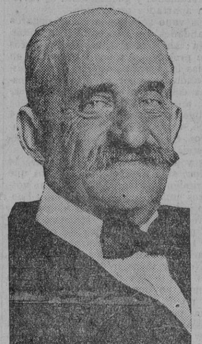
El conde de Romanones, que tan principal papel ha jugado en la crisis política, y que parece desempeñará la cartera de Estado en el nuevo Gabinete.

A las doce y media terminó la reunión. El marqués de Alhucemas, que fué el primero en salir de ella, dijo