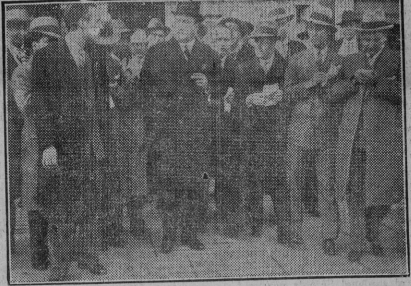
MADRID.—El jefe del Gobierno, general Berenguer, al salir de Palacio después de despachar con el Soberano é informarle de la marcha a la normalidad.

¡Las obras del nuevo Matadero! ¿Cómo pasa el tiempo! Galerín.