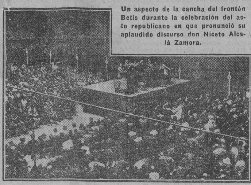
Un aspecto de la cancha del frontón Betis durante la celebración del acto republicano en que pronunció su aplaudido discurso don Niceto Alcalá Zamora.

Madrid 19.—Un periódico publica un editorial en el que se pregunta si hay ministro de Estado en España, y dice que el titular, el duque de Alba, difícilmente podrá contestar á esta pregunta porque se encuentra en Suiza, como antes estuvo en París ó en Londres, ó en cualquier gran ciudad de Europa que no sea Madrid. Sigue diciendo que el jefe del Gobierno si puede dar respuesta, y que por muy grande que se sea no se tiene derecho á dejar indefensos los intereses nacionales que se le tienen confiados. Continúa manifestando que es cierto que no solicitó la cartera de Estado, para la cual no está preparado, y que sus gustos no se dirigen hacia la política; pero estima que debe abandonar, precisamente por estas causas, el ministerio, para que los sacratismos intereses nacionales puedan estar defendidos debidamente. No se extraña de que en Francia y otros Estados se pregunten lo mismo que ellos; es decir, si hay ministro de Estado en España. Termina el suelto insistiendo en la necesidad de elegir al duque de Alba el abandono de su cartera.