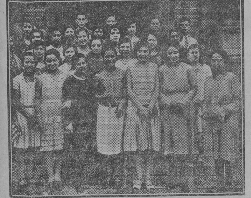
Grupo de aprendices de sastré que han tomado parte en el concurso celebrado hoy con motivo de la Asamblea regional de la Sastrería Andaluza