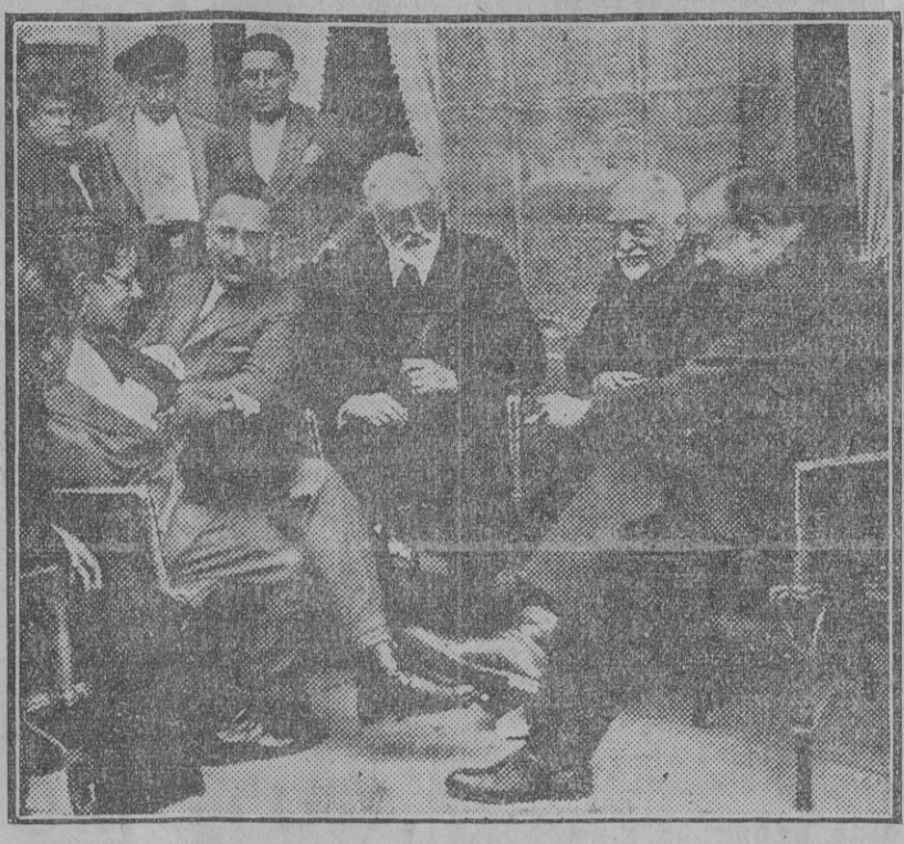
D. Miguel Unamuno con los Sres. Madrazo, Cossío y Del Río, momentos antes de comenzar el banquete republicano de Torrelavega (Foto. Agencia Gráfica). (Fotografiado Gori).

Respecto á la enseñanza superior, llevará al Consejo la modificación al régimen de 1928.