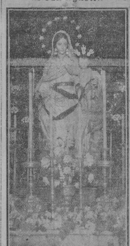
Imagen de Nuestra Señora de Consolación.